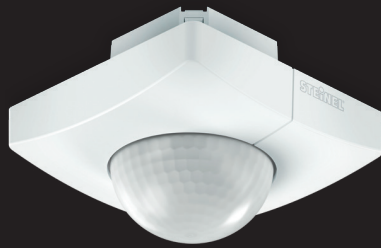
IS 3360 MX Highbay