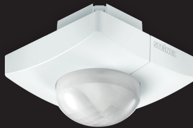
IS 345 MX Highbay